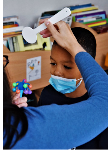
Les séances de dépistage : les élèves sont vus un par un par les orthoptistes, qui leur font passer plusieurs tests visuels afin de déterminer s'ils ont besoin d'une consultation ophtalmologique.

Ces premières phases du programme sont désormais terminées au sein des écoles du réseau Evariste Galois (Jacques Decour, Pablo Picasso, Robespierre et Evariste Galois). Les accompagnements aux rendez-vous ophtalmologiques à PointVision et à la générale d'Optique pour l'équipement en lunettes se termineront en février pour les familles des 8 écoles qui composent ce réseau.